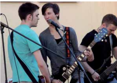
Band bei der Eröffnungsfeier