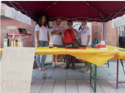
Stadtfestaktion – Kunst in der Kirche

lervertretung versucht zu erfragen, was sie denn wichtig fänden für ein funktionierendes Jugendcafe. Uns wurde klar, dass es nicht von Relevanz ist, die Leute mit Angeboten oder to do's zu überladen, sondern mit ihnen gemeinsam Projekte ins Leben zu rufen. Das soll nicht heißen, dass es nichts zu planen und vorzubereiten gibt, aber wir nannten es „Offenes Wohnzimmer Konzept“, um zu verdeutlichen, dass wir einen Ort brauchen, an dem wir zusammen sitzen, kochen, reden, planen und Projekte entwickeln können, mit jenen, mit denen wir uns vertraut fühlen – wo wir uns zu Hause fühlen.