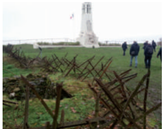
Anhöhe von Vauquois