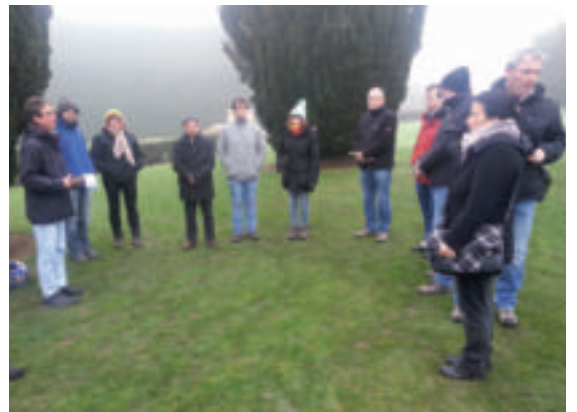
Morgenandacht auf dem Gräberfeld von Douaumont

Vikarin im Spezialvikariat im Landesjugendpfarramt