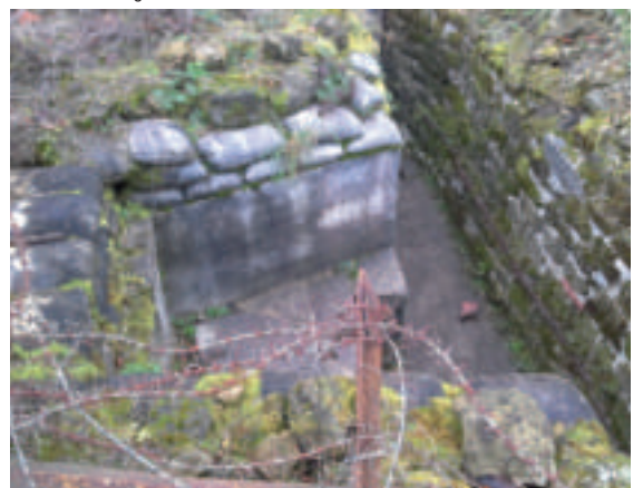
Schützengraben Tranchée de la Soif